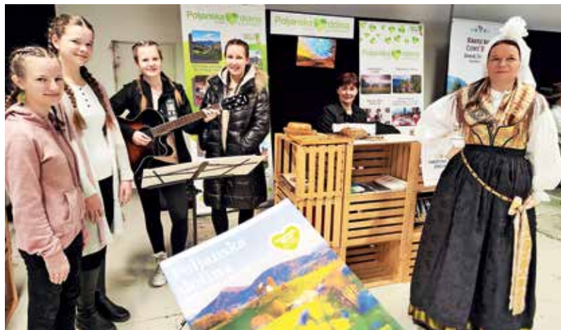
Na sejmu Alpe-Adria se je predstavil tudi Zavod Poljanska dolina.

Na štiridnevni sejmski predstavitvi ni manjkalo obiskovalcev. Zanimali so se predvsem za pohodne in kolesarske poti, vedno več je povpraševanja po postajališčih za avtodome. Obiskovalci so iskali ideje za enodnevne izlete in podaljšane konce tedna, zanimali so se za kulinarčno ponudbo in nastanitve. Precej povpraševanja smo zaznali za obisk utrdb Rupnikove linije, Dvorec Visoko in za dogodke v sklopu Tavčarjevega leta. Kljub vsemu pa je jasno, da prihodnje obiskovalce in tiste, ki se vračajo, za zdaj pritegneta predvsem narava in možnost aktivnega preživljanja prostega časa v ne preveč obljudenih ktičkih Poljanske doline.