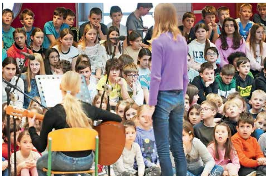
Prireditev ob kulturnem prazniku

Učenci šestih razredov so pri naravoslovju v okviru projektne naloge izdelali modele rastlinskih celic. Pri tem so uporabili znanje, ki so ga pridobili pri pouku naravoslovja. Na modelih so prikazali znanje o zgradbi rastlinske celice in inovativnost pri izbiri materialov. V prvem nadstropju šolskega hodnika je pripravljena razstava modelov, ki bo na ogled še nekaj časa.