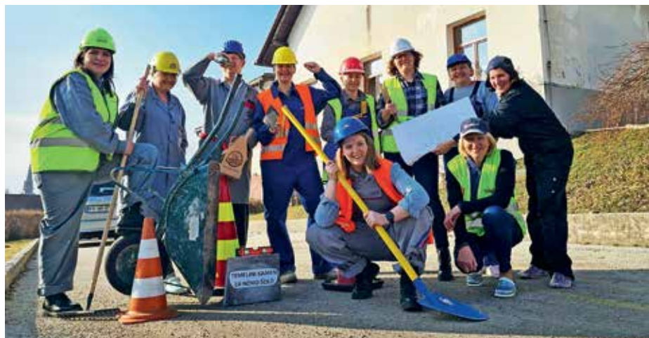
Učitelji in drugi delavci šole na pustni tork

štirideset let, je bilo povod, da so se učiteljice in učitelji ter sodelavci odločili, da bodo lopate in krampe vzeli v roke sami. Škoda le, ker je bil pustni tork in so že naslednji dan ponovno poprijeli za delo v šoli, ki ga na srečo staršev in otrok kljub zelo slabim razmeram srčno in z velikim veseljem opravljajo. Hvala jim za trud in tudi za to dobro pustno idejo. V Javorjah pa upajo, da bo temelji kamen v bližnji prihodnosti le našel svoje mesto sredi vasi.