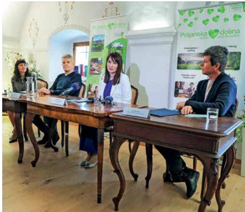
V Dvorcu Visoko so predstavili vrsto dogodkov, posvečenih pisatelju Ivanu Tavčarju, ki se bodo odvijali ob letošnjem Tavčarjevem letu.