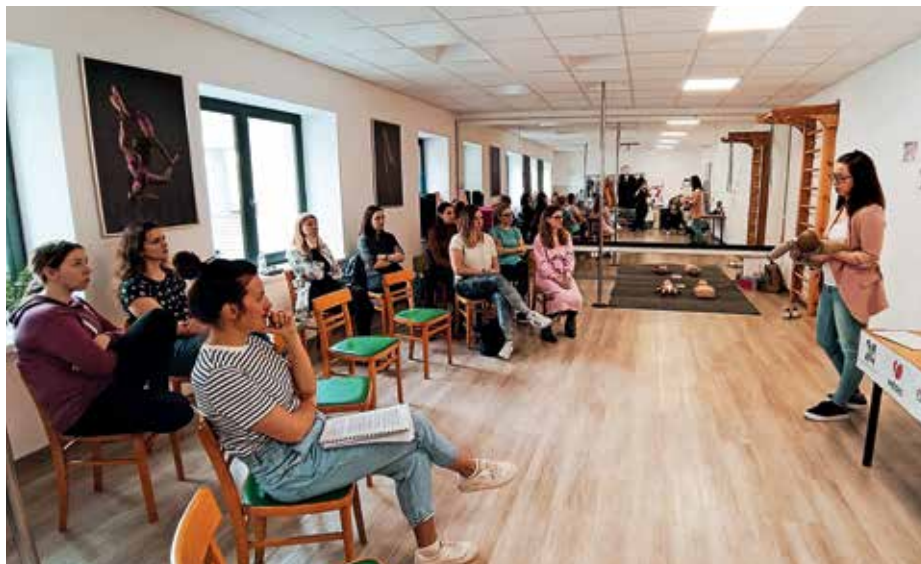
Z delavnice prve pomoči in temeljnih postopkov oživljanja za dojenčke v Gorenji vasi