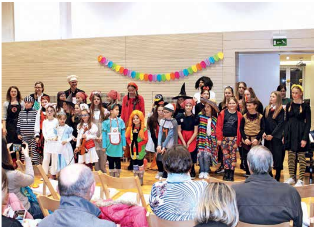
Pustni nastop učencev Glasbene šole Škofja Loka

Po nastopu so se nastopajoči učenci posladkali s krofi, nato pa pustne norčije shranili v omare in skrinje, iz katerih jih bodo ponovno potegnili prihodnje leto. V vmesnem času bodo nadaljevali marljivo vadbo in spoznavanje novih skladb za izbrane glasbene instrumente, pri čemer jih