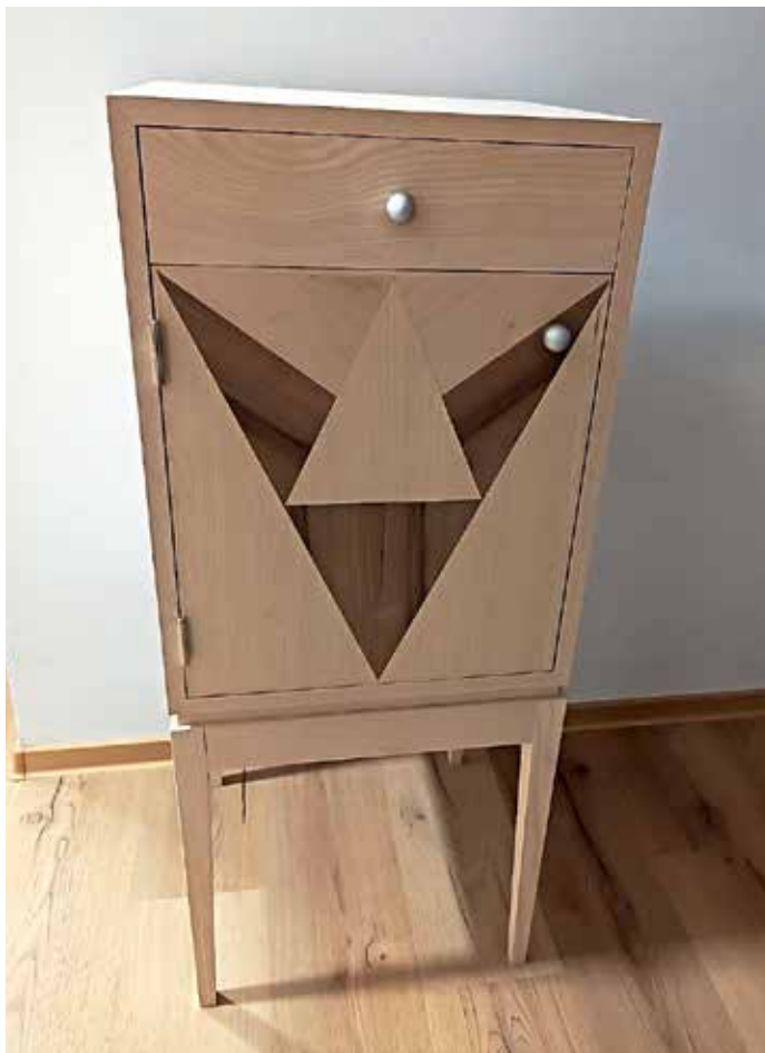
Ognjenov zmagovalni izdelek na tekmovanju SloveniaSkills