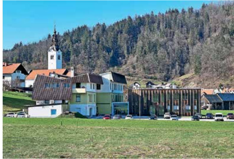
V Gorenji vasi jim je uspelo razviti sodoben zdravstveni center vrhunskih strokovnjakov.

Poleg tega spodbujajo vrsto drugih dejavnosti: podpirajo delovanje krajevne enote Rdečega križa, preventivne programe CSD Škofja Loka, kot so socialno vključevanje posebej ranljivih skupin, programe Sožitja (društva za pomoč osebam z motnjami v razvoju), sofinancirajo zdravstveno letovanje otrok na Debelem rtiču, programe na področju socialno-humanitarnih dejavnosti, programa pomoč na domu in družinski pomočnik ter izvajajo prostovoljski projekt Prostofer. Ker zdravje sodi med najpomembnejše prvine kakovosti življenja v nekem okolju, pa so na občini ponosni tudi na prizadevanja obeh osnovnih šol za športno udejstvovanje in skrb za boljše zdravje in počutje otrok in mladostnikov.