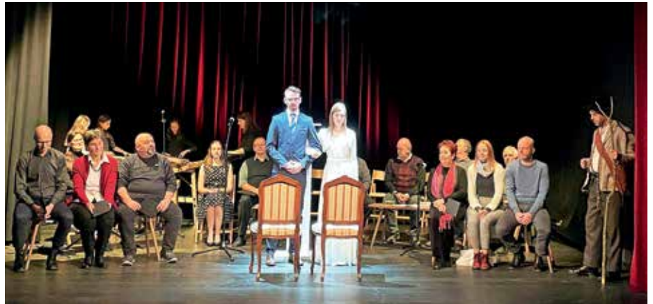
Ljubezen po Tavčarju na odru Sokolskega doma ob kulturnem prazniku

čarjem, saj je za ohranjanje spomina na Tavčarja in njegovo delo naredila največ, »veliko več kot država in visoka kultura«. »Leta 1951 je Poljane in Visoko obiskala močna državna delegacija. Šele po 72 letih bodo državni uradniki spet prihajali v Poljansko dolino ob obletnici njegove smrti. Visoka kultura je res vključila Tavčarja v šolske programe, v film, muzikal ter novo dramatisacijo Visoške kronike, vmes so ljubiteljski ustvarjalci po Sloveniji in v Poljanski dolini uprizarjali njegova dela, v ospredju so bila prizadevanja poljanskega kulturnega društva, pod čigar okriljem je bilo izdanih nekaj del z besedili v poljanskem narečju, narejeni dramatisaciji Visoške kronike in Šarevčeve slive, večkrat organizirani Tavčarjevi dnevi, okrogle mize itd. V Poljanah so že najmanj 75 let prisotna dejanja, ki so vtisnila Tavčarja v kulturno zavest lokalnega prebivalstva in širše,« je poudaril in obljubil, da si bodo s predstavniki drugih