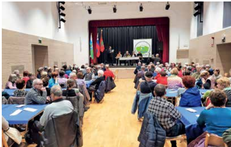
Številna udeležba članov Društva upokojencev za Poljansko dolino na rednem občnem zboru v marcu