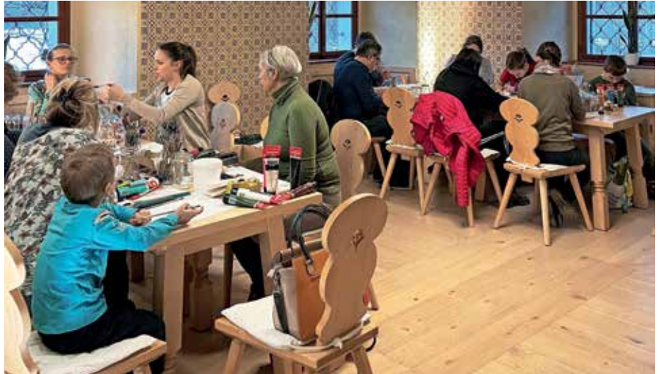
Delavnica izdelave nakita