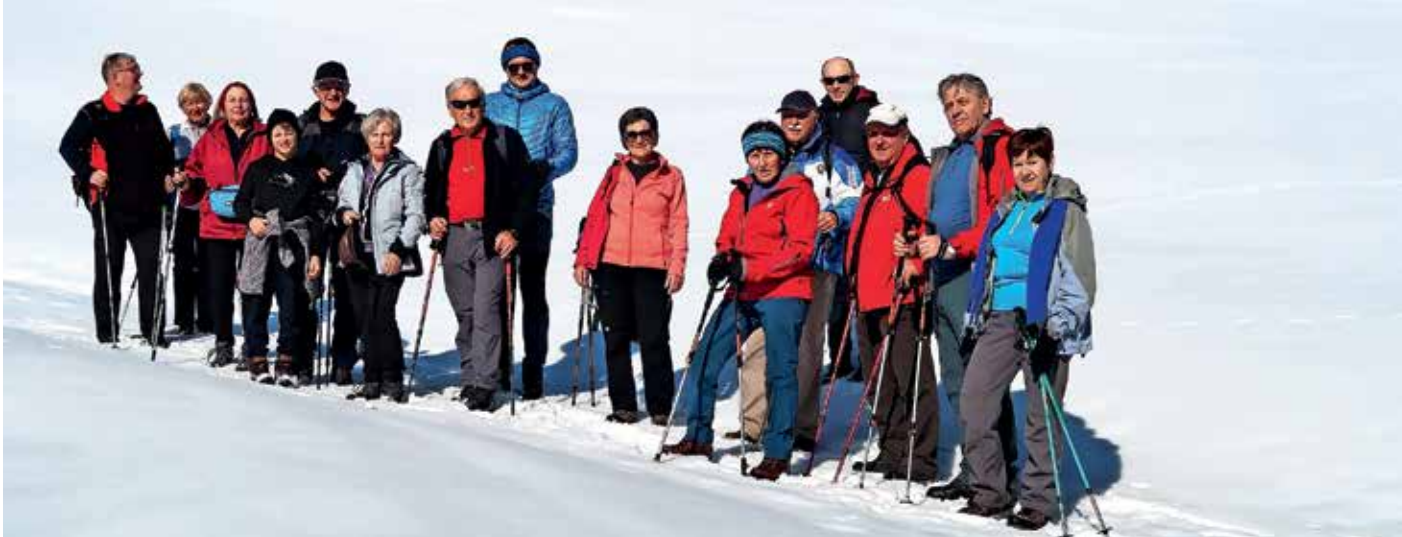
Udeleženci Zimskega pohoda