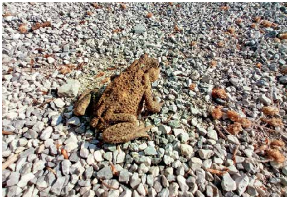
Pazimo na dvoživke na cestah in drugih javnih površinah.

Letošnje zimske temperature so bile v januarju tako visoke, da smo lahko celo pozimi srečevali močerade. Prve, po navadi že v februarju, se na selitveno pot do vode odpravijo rjave žabe in krastače, nato še pupki, zelene žabe in zelene rege. Verjetno je vsem znano, da dvoživke živijo v dveh življenjskih prostorih, v vodi in na kopnem. Vendar so na vodo vezane predvsem v času razvoja iz jajc v odrasle živali. Odrasli osebki večine vrst dvoživk namreč sploh ne živijo v vodi, temveč se tam zberejo le v času razmnoževanja. V občini Gorenja vas - Poljane je nekaj vodnih teles, ki so mrestišča za dvoživke, na primer toplotni izvir v dolini Kopačnice, pritoki Poljanske Sore, jarki potoka Mihevk in mlaka v Žabji vasi. Žabja vas nima takšnega imena brez razloga. Sredi vasi je mlaka, v katero vsako leto pride odlagati jajca več kot sto osebkov sekulj. Sekulje spadajo med rjave žabe, ki imajo hrbet rjave, rdečkaste do olivno zelene barve z vzorcem temnejših lis, trebuh je svetlejše barve. Čez oči imajo temno rjavo masko. Od podobne rosnice