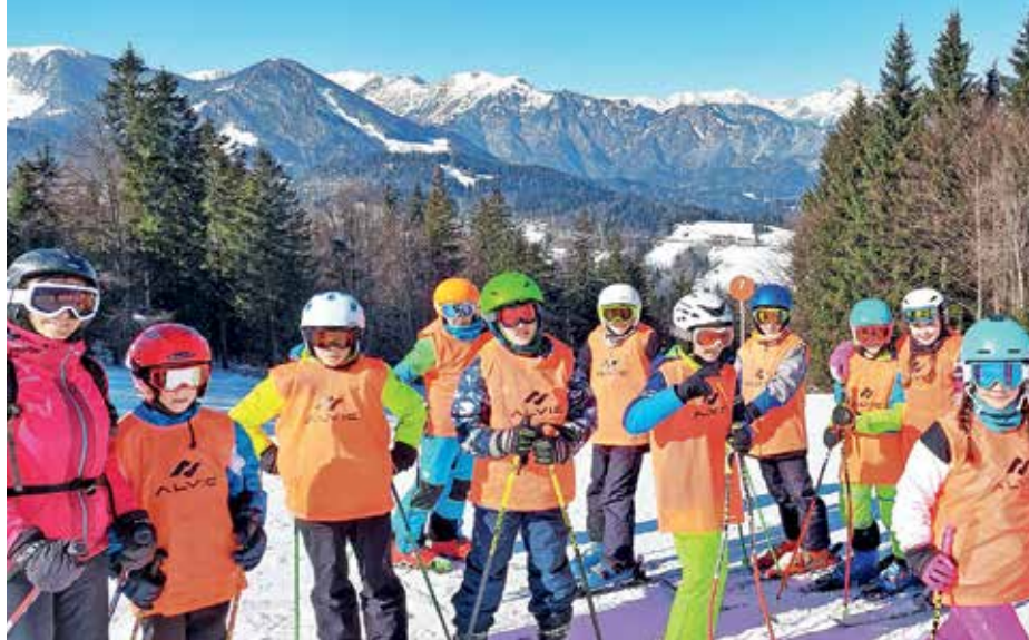
V smučarski šoli na Črnem vrhu

Šolsko prvenstvo v badmintonu se je odvijalo 9. januarja. Tekmovanja se je udeležilo 15 učencev od šestega do devetega razreda. Na prvih treh stopničkih so pri