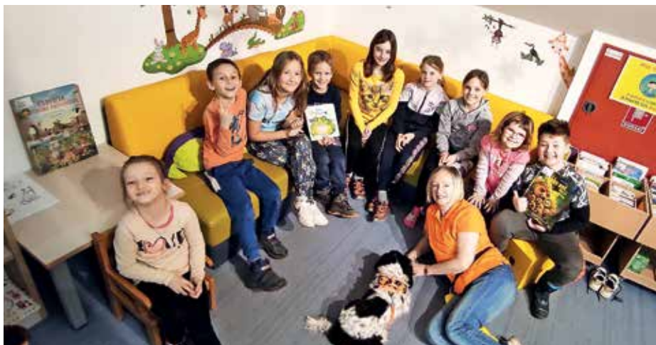
Marčevsko srečanje z Ambasadorji nasmeha

Flynn, Vince: SMRTONOSNI STREL French, Tana: V GOZDU Grošelj, Viki: KRIŽ ČEZ NEPAL Hansen, Anders: KO MOŽGANI BLUZIJO . Odveza vsem, ki ste tesnobni in depresivni Lainšček, Feri: PETELINJE JAJCE Mazzini, Miha: OSEBNO MONTESSORI za vsako družino: praktični vodnik za vzgojo in življenje po metodi montessori Mosley, Michael: BREZ MUK V SPANJE Phillips, Susan Elizabeth: V VRTINCU ZVEZD Stasiuk, Andrzej: PREVOZ