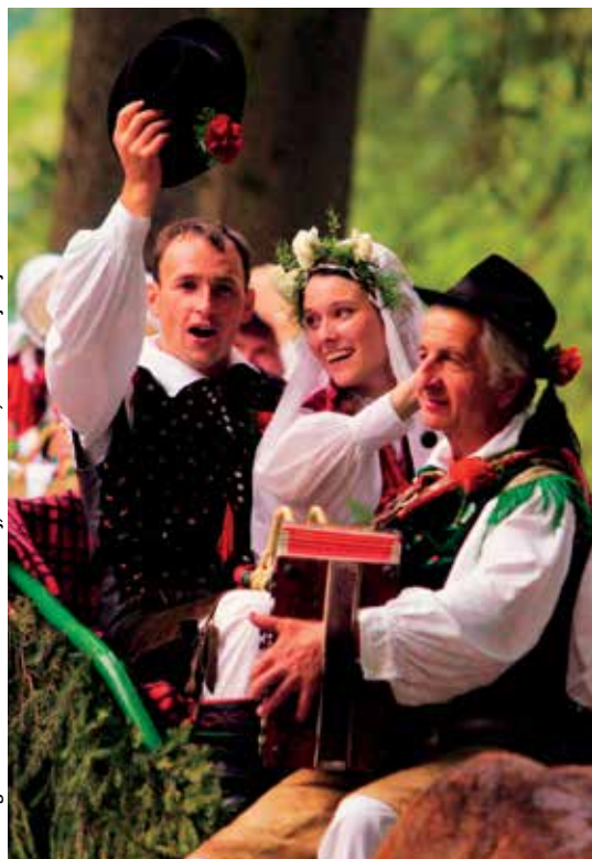
Organizator: Turistično društvo Bohinj, Ritbečev Laz 48, 4265 Bohinjsko jezero

v sodelovanju s Kulturnim društvom dr. Ivan Tavčar Gorenja vas, bodo spomladi izpeljali še en nastop na tej lokaciji, z muziciranjem pa bodo učenci Glasbene šole Škofja Loka popestrili tudi druge lokalne prireditve.