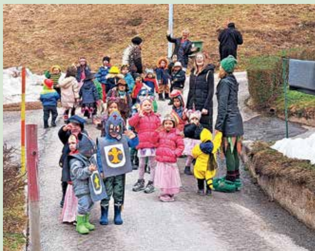
Male maškare iz vrtca Sovodenj

Prikupno fotografijo, ki je nastala ob letošnjem pustu, nam je poslal Denis Debeljak s Sovodnja. Male maškare iz vrtca Sovodenj so ga namreč s svojimi pustnimi kostumi tako navdušile, da se je odločil narediti fotografijo za spomin, vzgojiteljica pa mu je nato v šali rekla, ali je to za Podblegaške novice. »Meni se je to zdela dobra ideja,« je svojo odločitev, da nam pošlje fotografijo, pojasnil Debeljak. Seveda pa je male maškare nagradil tudi z bombončki in drugimi sladkarijami.