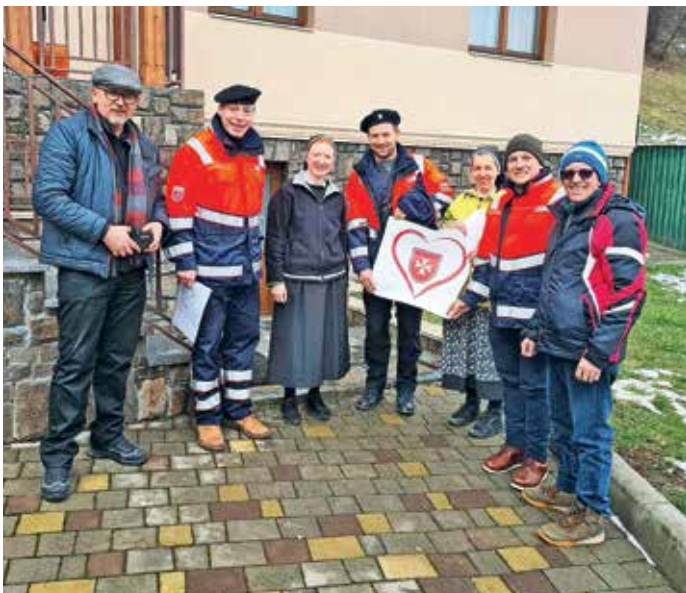
Pri slovenskih sestrah v Ukrajini