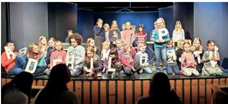
Abeceda učencev Podružnične šole Sovodenj

Mika nas mika zven slovenskega jezika Slovenski kulturni praznik smo Sovodenjčani ponovno lahko praznovali sproščeno, družno in ponosno v dvorani. Spet so oživele aktivnosti različnih kulturnih skupin, ki so rezultate dela in truda ponudile kar številnemu občinstvu v dvorani. Zapel je mešani cerkveni pevski zbor in pevke Grabljice. Dva venčka je zaplesala folklorna skupina turističnega društva, ki se intenzivno pripravlja na plesno gostovanje v Ameriki. Z rimanimi besedami so se spoprijeli član kulturnega društva in učenci podružnične šole. Slednji so zatrdili, da »z abecedo našo ves svet se nam naslika, da med tabo in mano, med nami, med vami je tisoč besed in zato nismo sami«. Tudi ritem jih je peljal po zvočnih poteh, saj so abecedne deklamacije z zvoki obogatili še učenci pevci in zvočna Orffova kulisa. Ves program so dopolnjevale in povezovalе skrbno izbrane ter v poduk podane besede in misli o delu pesnika Prešerna v izvedbi Štefke Eržen.