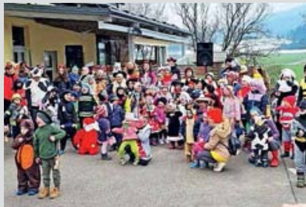
Veselo pustno rajanje

Na pustno soboto so se male in velike maškare zbrale na parkirišču v Blatih in se v sprevodu ob spremljavi harmonike podale na rajanje pred Zrajdnca bar. Tam so se zabavale in plesale skupaj s Sneguljčičo in palčkom. Šeme, bilo jih