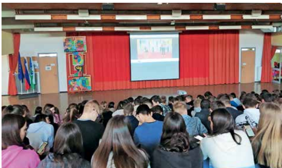
Na kvizu za Guinnessovo knjigo rekordov

Prvošolci so na pustni torek prišli v šolo oblečeni v maškare. Spoznavali so ljudski običaj in različne maske. Kulturni dan so zaključili s pustnim rajanjem v telovadnici.