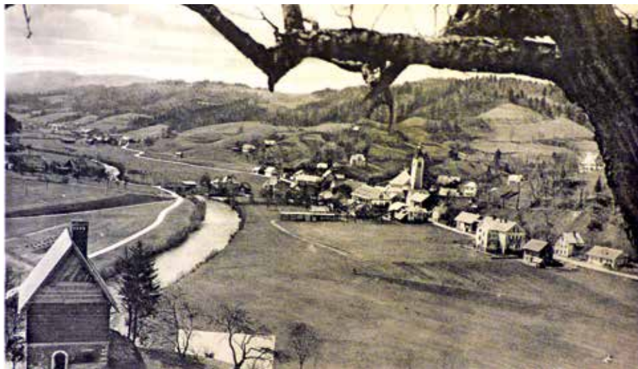
Poljane v poznih 30. letih 20. stoletja na razglednici

Razglednice so v dobi, ko še ni bilo elektronskih medijev, pomenile pomemben korak v napredku komunikacije. Z njimi so naslovniku poslali poleg pisnega tudi vizualno sporočilo. Razglednice s fotografijo domačega kraja so lajšale domotožje osebam, ki so se preselile daleč od doma. Tudi Poljane so že zgodaj dobile svoje razglednice. Običajno je bila v kakovostni fotografski tehniki posneta panorama naselja, ki ga je do leta 1954 označevala markantna stavba cerkve sv. Martina in gruča hiš starega vaškega jedra okrog nje