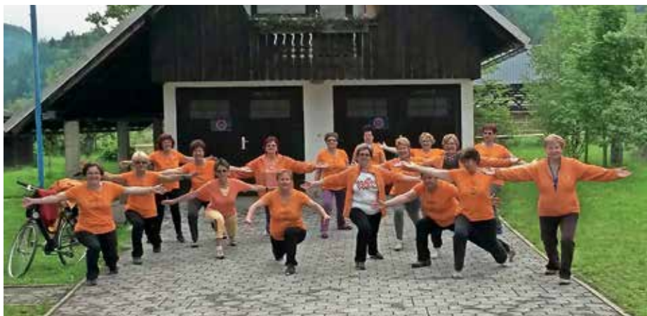
Jutranja vadba 1000 gibov

Organizatorji so dosegljivi na elektronskem naslovu info@solazdravja.si ali po telefonu 059 932 066. Če se vas bo zbralo dovolj, bodo organizirali poskusne vadb v vašem kraju in tako spodbudili vaše lokalno okolje k rekreaciji, ki postaja vse bolj priljubljena med starejšimi. Vadi namreč že več kot štiri tisoč članov društva na več kot 250 lokacijah po Sloveniji. Jutranja vadba 1000 gibov poteka na prostem, v parkih, na zelenicah in igriščih. Vsako jutro ob 7.30 ali 8. uri zjutraj se vadeči zberejo na 30-minutni vadbi, sestavljeni iz stoječih vaj, s katerimi lahko razgibate in ogrejete celo telo, od dlani do stopal. Vadba je primerna za vse generacije, vsak si jo prilagodi glede na svoje zmožnosti. Vse, kar potrebujete, so udobna oblačila in športni copati. Društvo šola zdravja je humanitarna organizacija, ki skrbi za promocijo gibanja